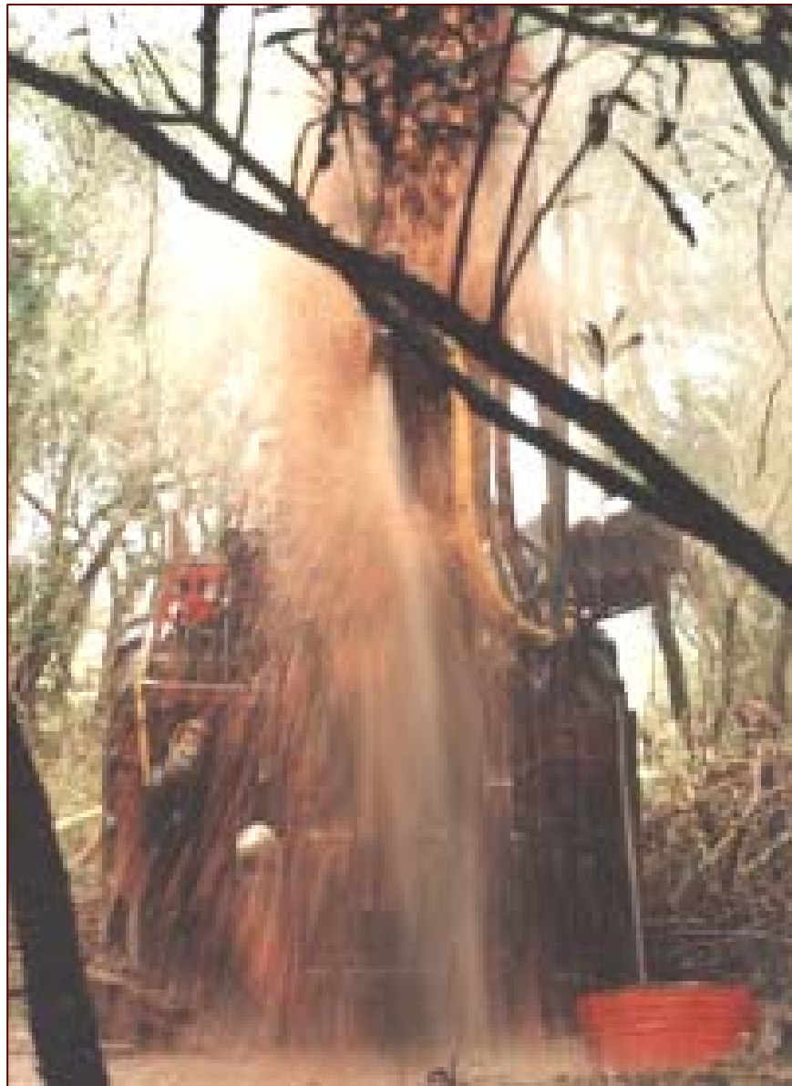
Perforación para extracción de agua subterránea en Basamento Cristalino. Uruguay.